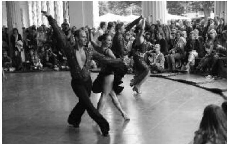
Sehr werbewirksam: Outdoor-Showprogramm beeindruckt das Aachener Publikum

Einmal jährlich sorgen die Mitglieder des Vereins dafür, dass sich die Rotunde des Eisenbrunnens, eines der historischen Architekturdenkmäler mitten in Aachen, von der Säulen umsäumten Wandelhalle zur Zuschauer umdrängten Tanzbühne verwandelt. Und dann zeigt sich, dass Tanzen – live und in Farbe – mindestens genauso viele Menschen anzieht und begeistert wie der „gemeine“ Rasensport.